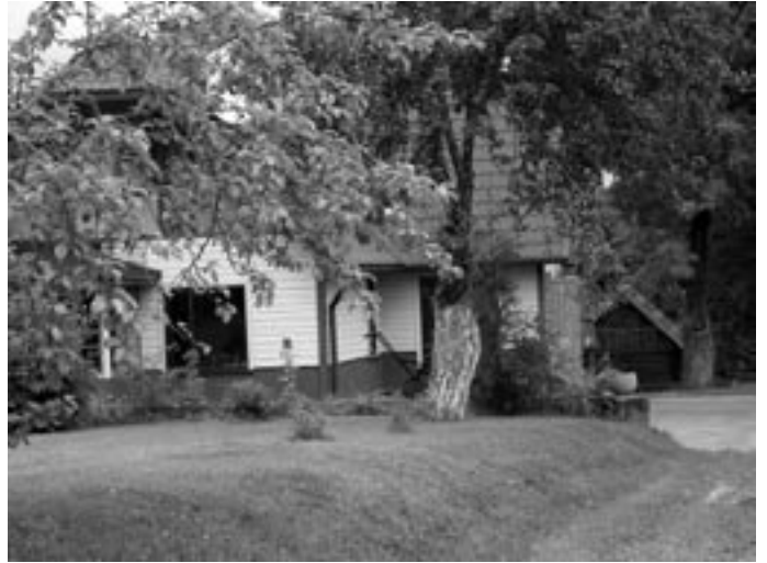
Perekond Ossipi kodu Kaagvere külas,