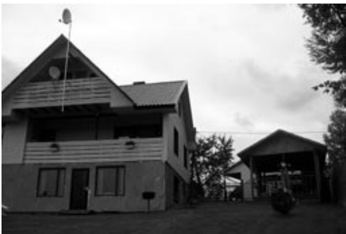
Perekond Kalbergi kodu Mäksa külas.

Õnne emale, õnne isale, õnne perelisale!