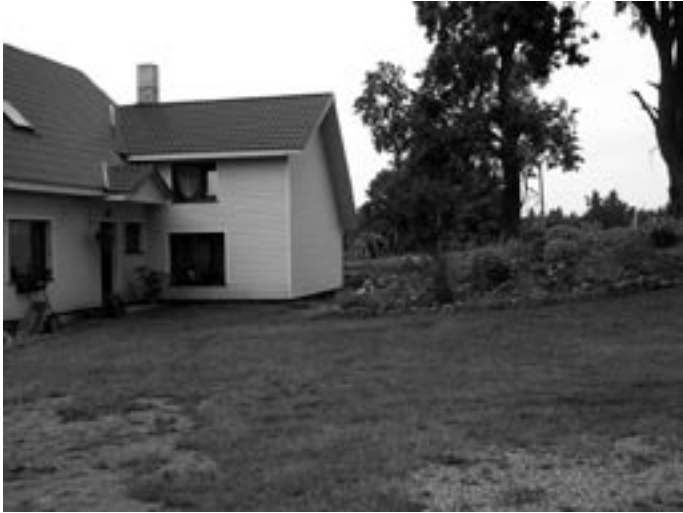
Perekond Kondike kodu Mäletjärve külas,