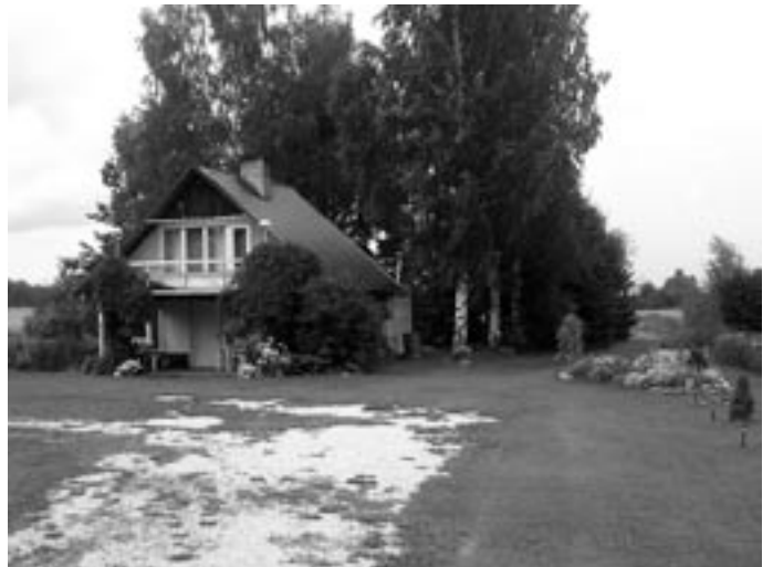
Perekond Sooaru kodu Kaarlimõisa külas,