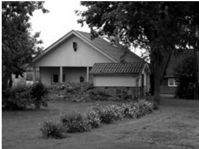
AS Ekaros P.V.M kinnistu Kaagvere külas,