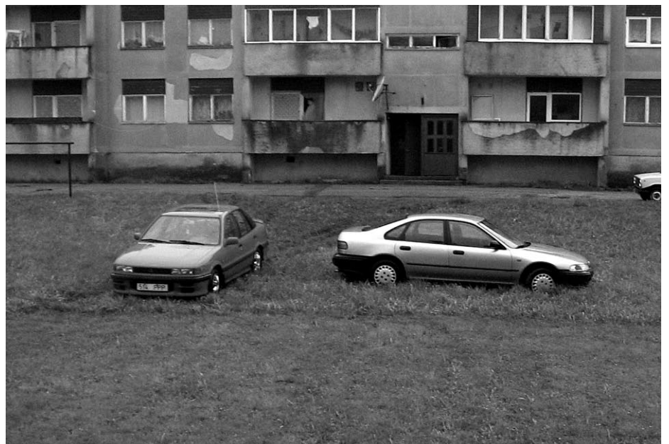
Kumb auto on valesti pargitud?