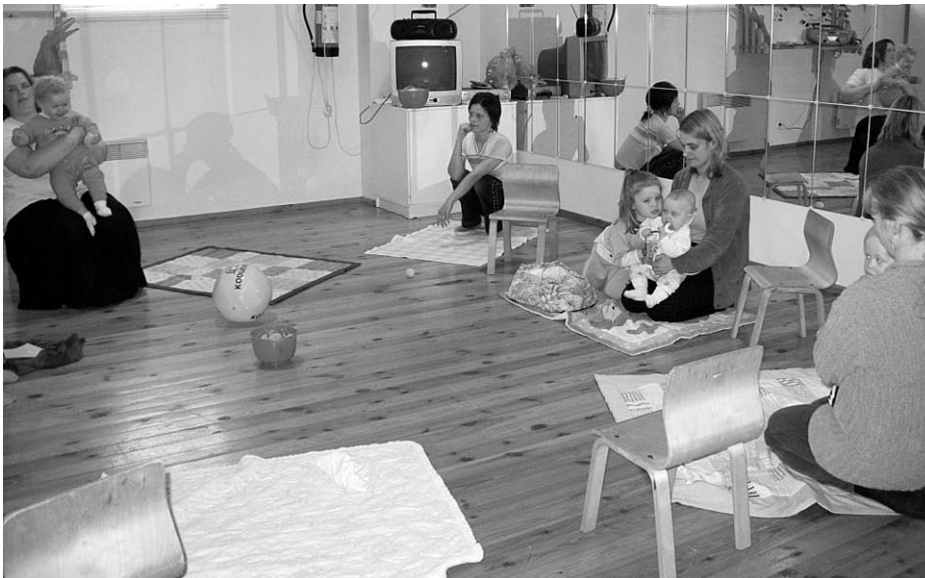
Lapsed on elu õied (Melliste beebikool)