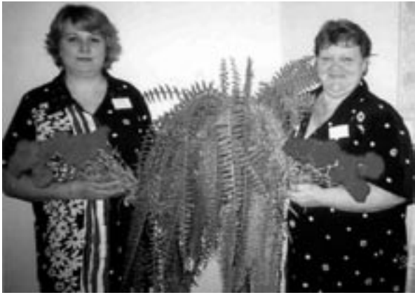
Hooldekodu Härmalõng 2006.a. parimad hoolekandetöötajad