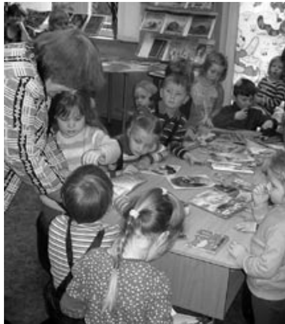
Kevade sünnipäev Melliste raamatukogus.