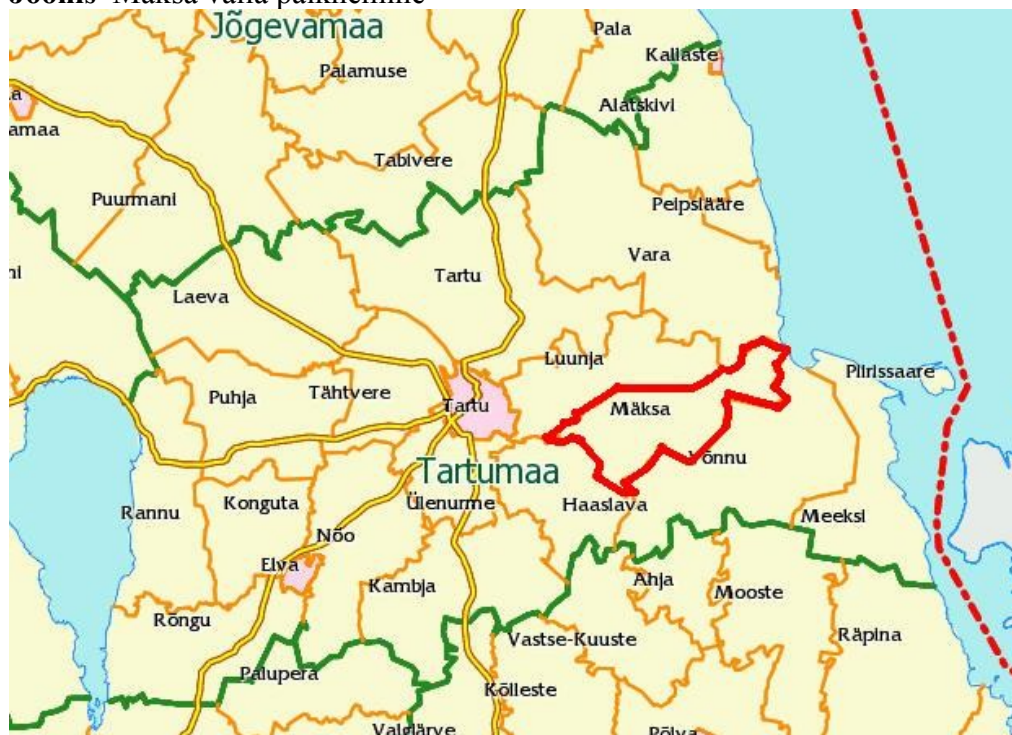
Joonis Mäksa valla paiknemine

Mäksa vald paikneb Tartu maakonnas, asudes Tartu linnast kagus. Omavalitsuse piir kulgeb põhjast mööda Emajõe ja piirneb Luunja vallaga, idast Kalli järve ning Vara ja Võnnu valdadega, lõunast Võnnu vallaga ning läänest Haaslava vallaga.